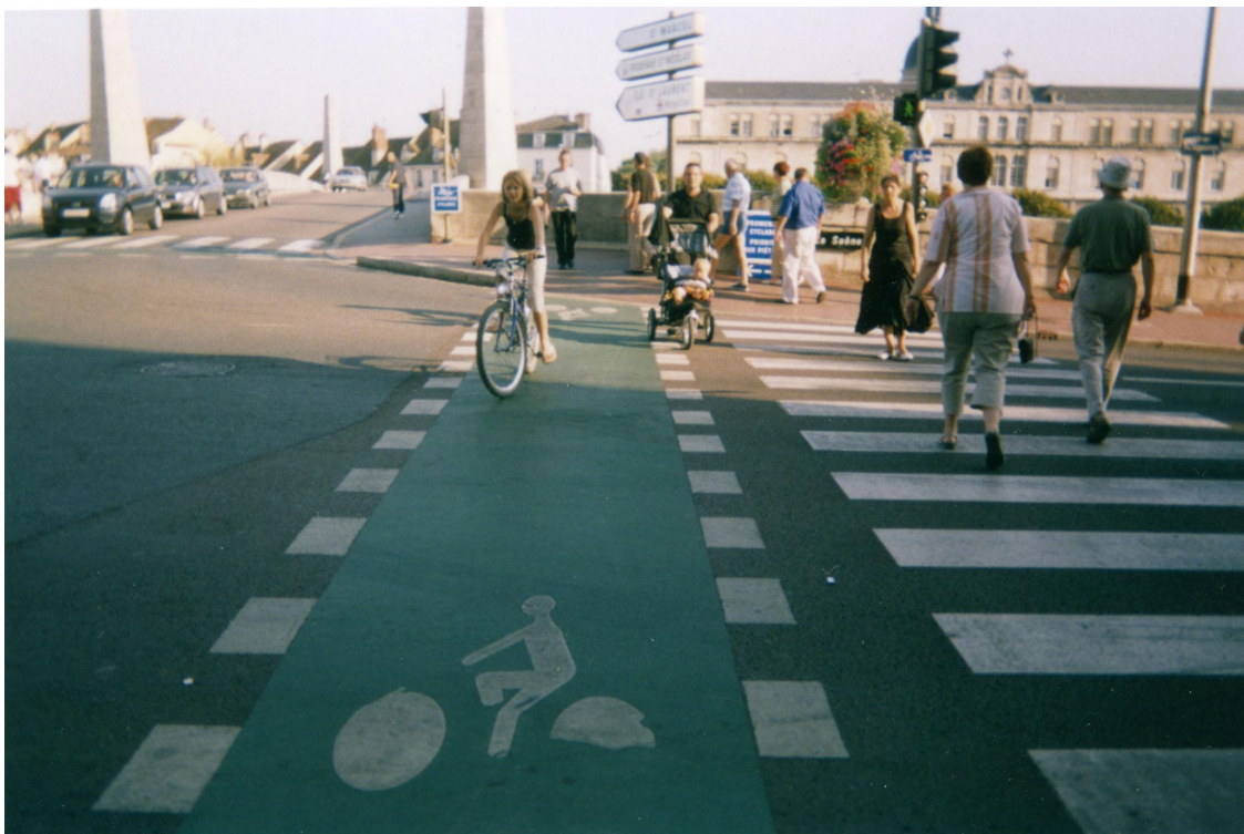
Ville de Chalon / Saône