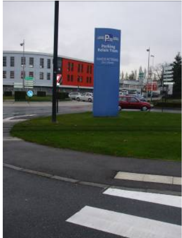
Parking couvert et sécurisé, surveillé