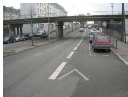
Bd Roch côté Min