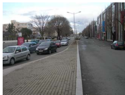
rue Gaétan Rondeau