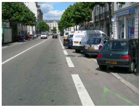
Entre le Bd Roch et Place de la République