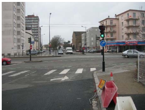
Depuis la rue Louis Joxe c'est interdit.