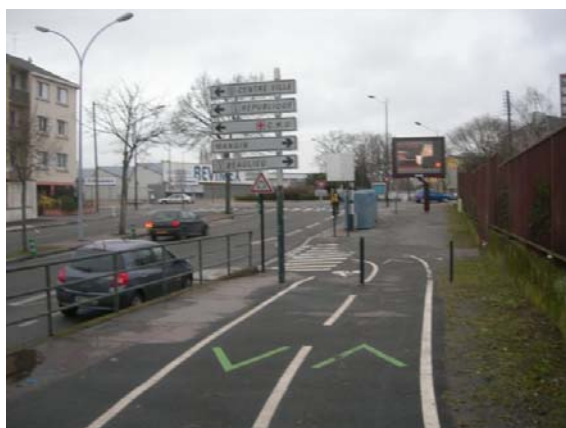
Vue vers Victor Hugo depuis le pont

Améliorer l'accès à la piste cyclable rejoignant le pont de Pornic par la rue du Scorff, particulièrement venant de Victor Hugo.