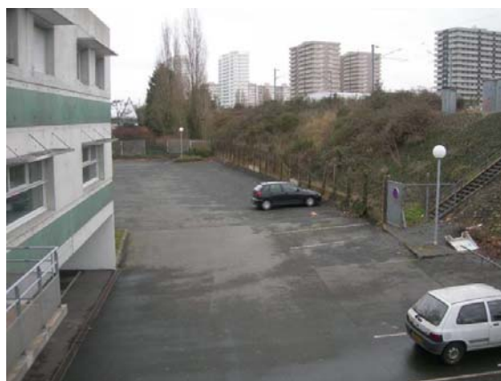
Parking privé le long de la voie ferrée