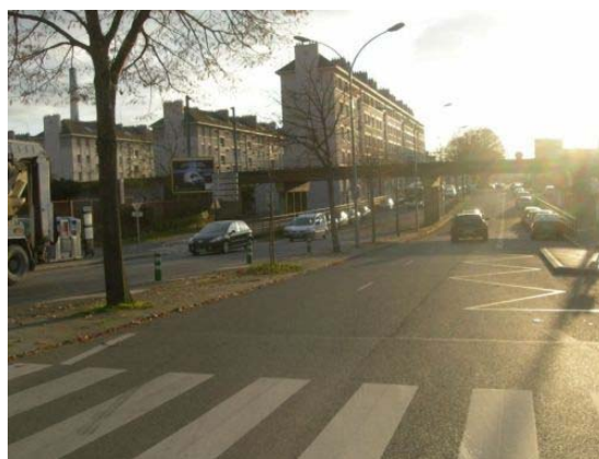
Vue de Victor Hugo