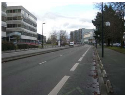
Rue René Viviani