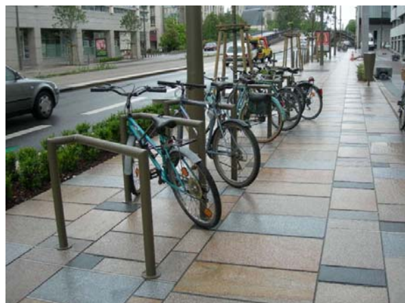
Les nouveaux sont corrects.