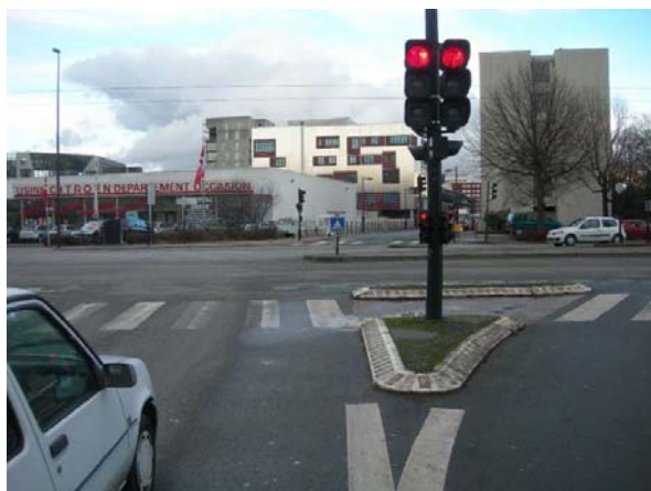
Depuis le Bd Roch c'est possible.

Actuellement interdite, cette traversée doit être facilitée pour les vélos. Cet itinéraire est plus intéressant que celui traversant à Vincent Gâche – Babin-Chevaye.