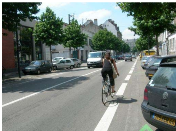
Bd Victor Hugo

Gênant pour tous. Les véhiculent empiètent à la fois sur la bande cyclable et l'espace piéton déjà bien restreint. Le gros point noir est le Bd Victor Hugo. Vraiment très dangereux entre République et Roch. Passer au stationnement longitudinal.