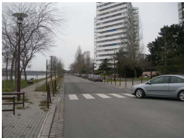
vue vers l'ouest

Il faut établir une piste confortable sur toute la longueur entre Mangin et le Crapa à double sens côté Loire à hauteur de chaussée avec des accès faciles.