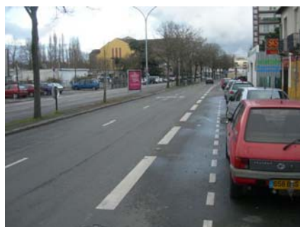
Bd Roch côté Martyrs