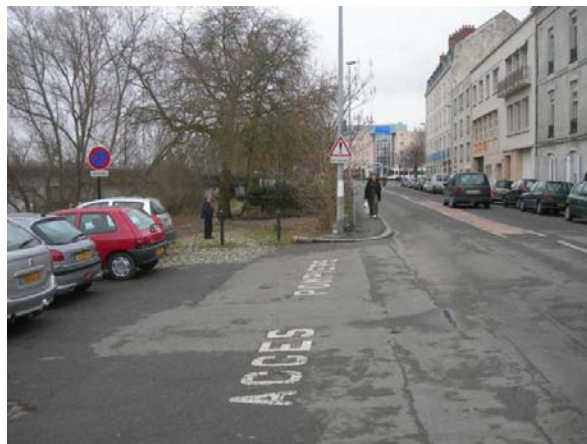
Pont Audibert vu du quai Hoche