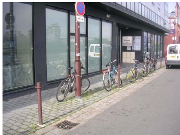
Manque quai Mitterrand devant France Bleu et Ouest-France