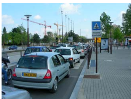
Bd De Gaulle

Les accès aux giratoires sont beaucoup plus délicats en cas de files multiples, surtout pour les tourne à gauche.