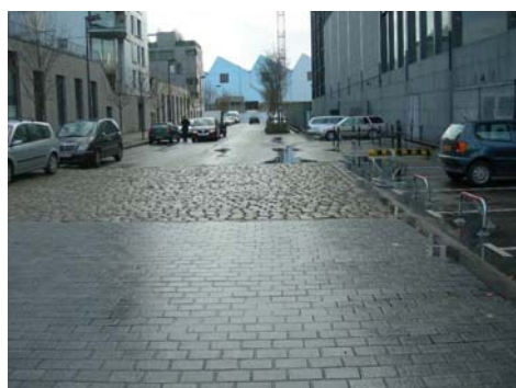
rue Olympe de Gouges

De mauvais exemples sont les passages pavés très inconfortables des rues Olympe de Gouges et Arthur III, de chaque côté du palais de Justice.