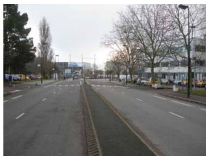
Rue René Viviani