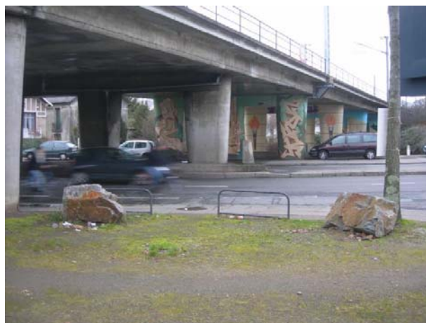
Franchissement du Bd Victor Hugo