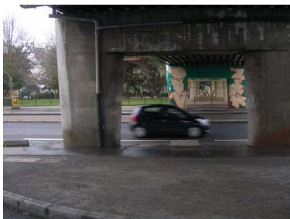
Franchissement du Bd des Martyrs