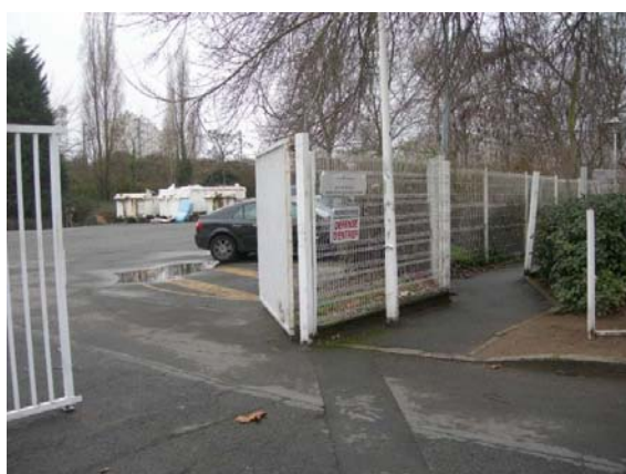
débouché du chemin piéton sur le stade Mangin-Beaulieu.. Services nettoyage du pôle Nantes-Loire