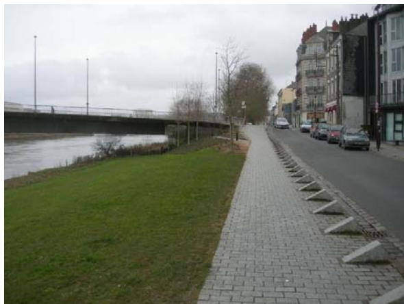
Pont Haudaudine vu du quai André Rhuys

Le quai Hoche va être aménagé. Ne pas oublier de créer un cheminement cyclable sous les ponts. Il y a la place