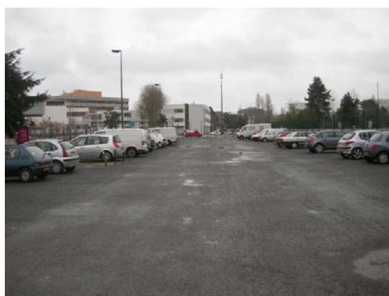
Bd Vincent Gâche vers Bd De Gaulle, futur emplacement de la ligne 5