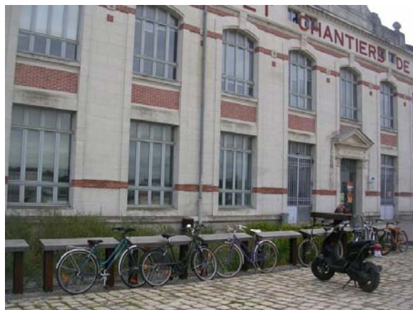
Manque devant la Maison des Hommes et des techniques

Le cycliste doit pouvoir trouver un appui-vélo sécurisant (où il peut attacher le cadre à un point fixe) dans tous les quartiers, bureaux et résidentiels.