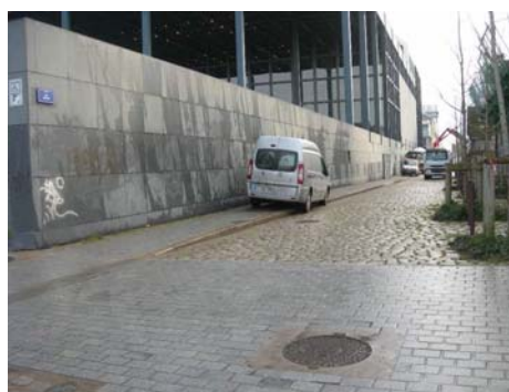
rue Arthur III