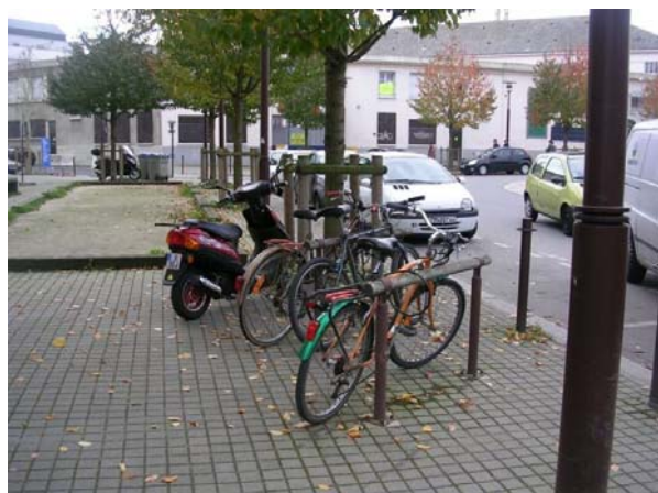
Les anciens appuis en bois ne sont pas sécurisants.