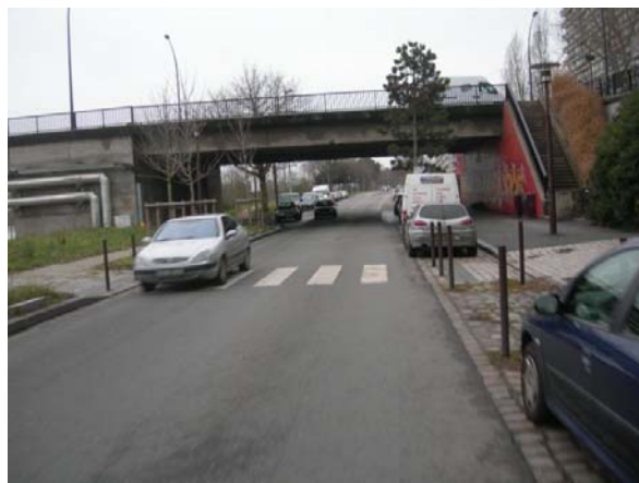
vue vers l'ouest sous le pont Clémenceau