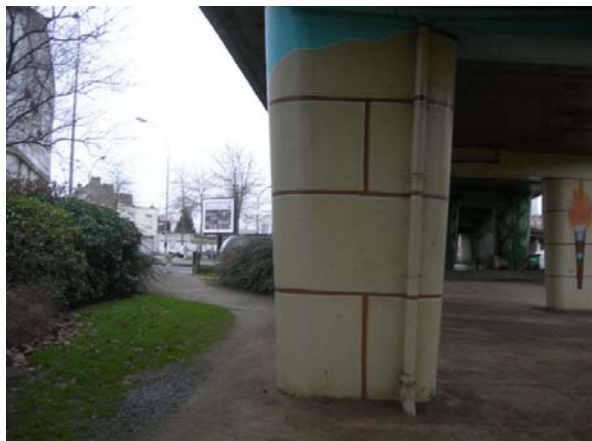
franchissement Bd Victor Hugo