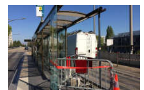
Gréneraie, abandon assumé avant projet non concerté

L'ANDE devra faire preuve de plus de réactivité sur ce sujet et aller rechercher plus d'informations auprès des usagers du quotidien