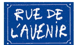
Un nouveau partenaire