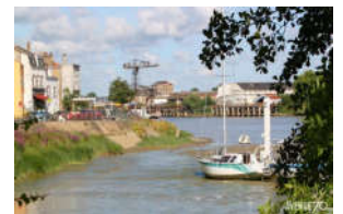
Trentemoult à mieux relier à Chantenay

Notre participation aux diverses instances de concertation et de proposition (Conseil de développement, Écopôle...) se poursuivent.. À noter cette année un nouveau partenariat avec la délégation régionale de « Rue de l'Avenir » qui devrait déboucher rapidement sur des projets communs (débat sur le stationnement dont les règles viennent d'être renouvelées)