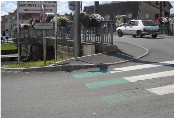
7-Ce n'est pas la véloroute mais voici encore un trottoir à gravier pour les cyclistes (l'Isle sur le Doubs). Aménagement à revoir complètement.