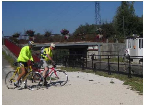
3-Attention : graviers ! Ces graviers dangereux semblent indispensables dans le Doubs alors qu'il n'y en a pas dans le Territoire ni dans le Haut-Rhin. A balayer au plus vite SVP !