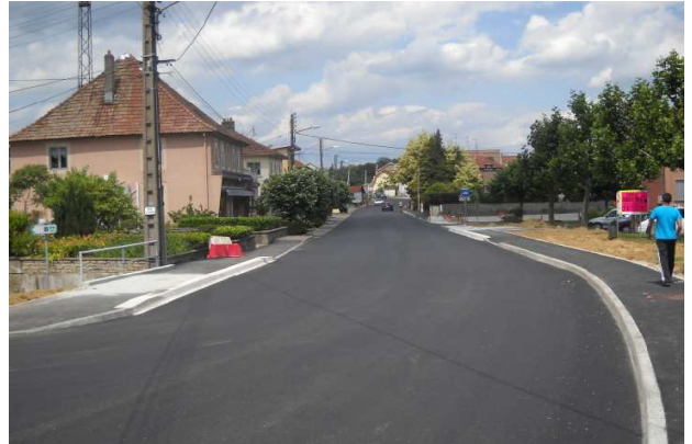
10-Voujeaucourt : la voirie a été refaite mais où est l'aménagement cyclable ?