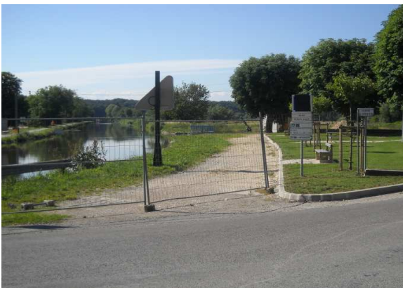
2-Passerelle sur l'Allan toujours en chantier...