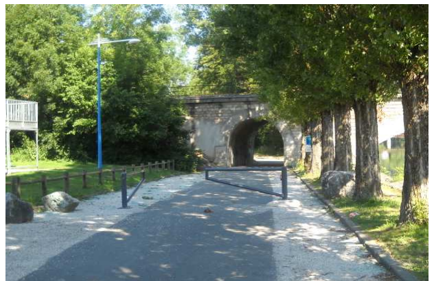
4-Barrières invisibles, gravillons... tous les ingrédients sont là pour un accident.