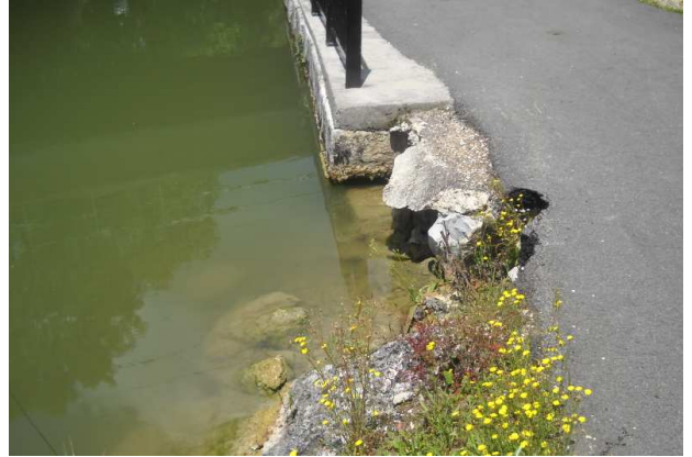
9-Attention : la berge s'effondre à proximité du pont du chemin de fer au nord de Saint Maurice Colombier.