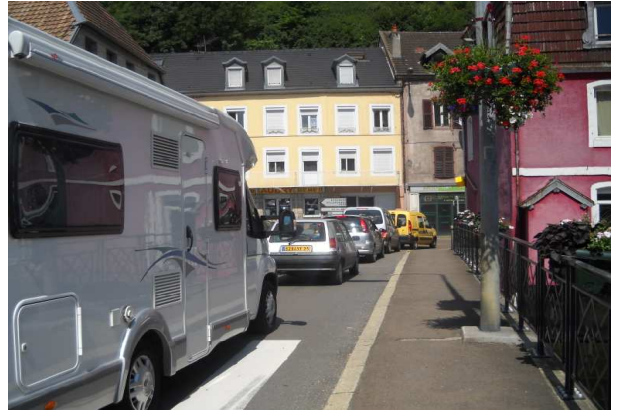
8-Ben oui ! Vous êtes sur la véloroute ! Nous attendons la passerelle de l'Isle sur le Doubs pour éviter ça !