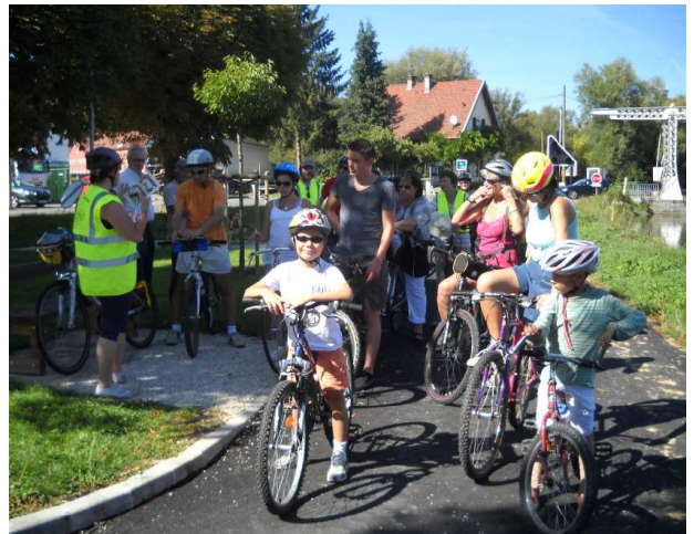
Précisions et conseils avant le départ

Balade commentée : la dernière balade, réalisée en collaboration avec PMA, s'est déroulée le samedi 10 septembre. Très beau temps et belle participation (22 personnes). Le parcours (Montbéliard, Voujaucourt, Audincourt, Exincourt et retour) nous a permis d'inaugurer (enfin !) la passerelle sur l'Allan entre Courcelles et Ste Suzanne.