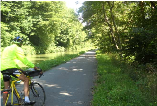
6-La véloroute comporte de charmants passages.