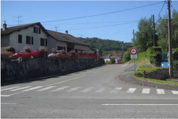
5-Dampierre s/Doubs, montée d'Etouvans. La véloroute est ici interrompue. Toujours pas de solution à cet itinéraire provisoire, qui dure !