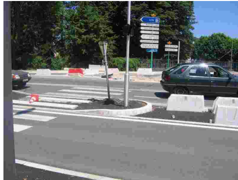
Sortie pont François Mitterrand non aménagée pour les cyclistes mais la circulation automobile est déjà rétablie...