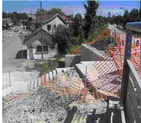
Piste d'Audincourt gare-pont de gland... il s'agit d'un accès à une piste cyclable ! VéloCITÉ a dénoncé un aménagement du même type devant le collège Jean Bauhin en demandant la mise en place d'une rampe...