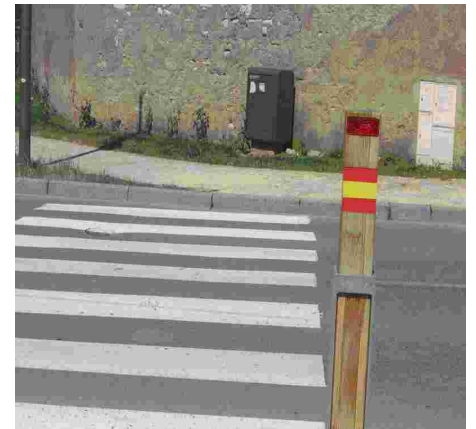
Une dernière photo pour aujourd'hui : rond-point du Mégarama. Où est passé le bateau ?