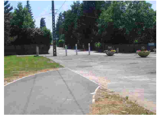
Valentigney : absence de liaison entre aménagements cyclables.