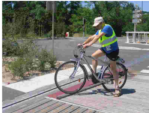
Nouveau pont de Valentigney : finition !