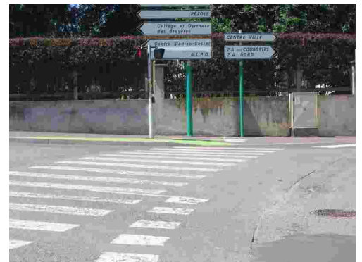
Valentigney : la piste se finit en queue de poisson.