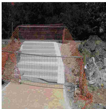
... un autre accès à la piste : ridicule ! ... à moins que dans l'esprit des aménageurs, la piste soit plutôt destinée au piétons... sans poussette ?