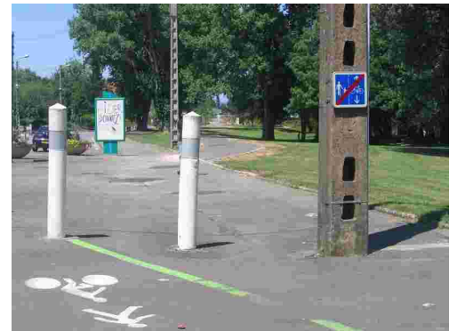
... manque de liaison vue de l'autre côté (rue des graviers)