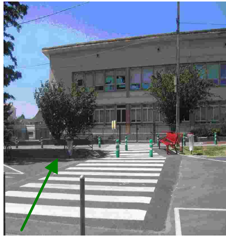
Ecole des acacias à Audincourt ; la piste cyclable (derrière la photographie) est encombrée par certains parents qui attendent leurs enfants à la sortie de l'école. Il est vrai que la place manque : le parking occupe tout l'espace alors qu'une placette pourrait être aménagée (flèche).