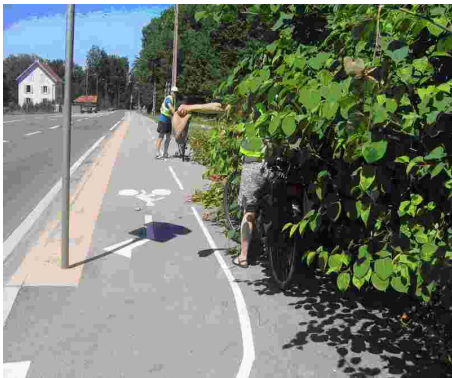
Cette fois-ci, c'est une cycliste qu'il faut chercher dans la végétation !