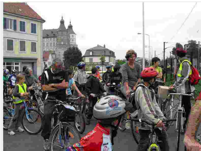
Quand un groupe regarde passer le groupe précédent...

Cette fête est déjà annoncée les 6 et 7 juin 2009 par le comité de promotion du vélo... nous y participerons !