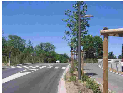
Nouveau pont de Valentigney : cherchez le feu rouge !