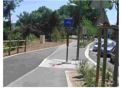
Un abribus va être installé... et la piste ??

Voici une partie des photos prises par Bernadette Chambert ; la liste n'est malheureusement pas exhaustive.