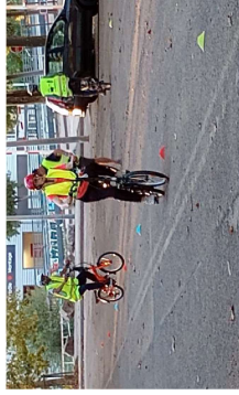
Apprentissage en plateau