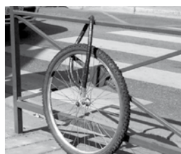
Cadre non attaché